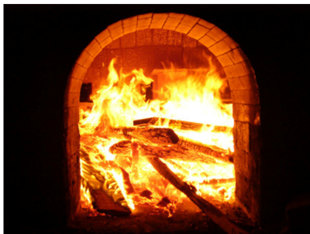
ミニ登り窯築窯1996(H8)年 しん窯青花20周年記念事業

お屠蘇気分も薄れ、工房内に活気が戻ってきました。吸塵機やコンプレッサーの音が時々けたたましい音をたてていますが、ほど良いリズム感があって眠気も吹っ飛びます。活気とは、職人さん達の内なるやる気であり、息づかいであると思います。活気みなぎる工房が有田じゅうに伝播していけば良いと思います。モノづくりの町。職人さんの町。世界の陶磁器産地のメッカ。大いなる田舎。このような有田を育てていきたいと思う次第です。