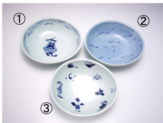
①紅毛青花たまご型井 ②魚群たまご型井 ③異人づくしたまご型井 各3,500円