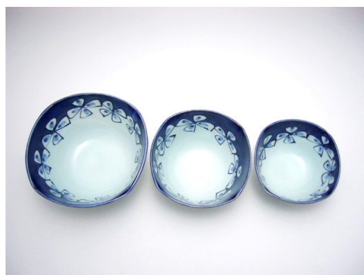
花つなぎ四角井 (大) 3,500円 (中) 2,800円 (小) 2,100円